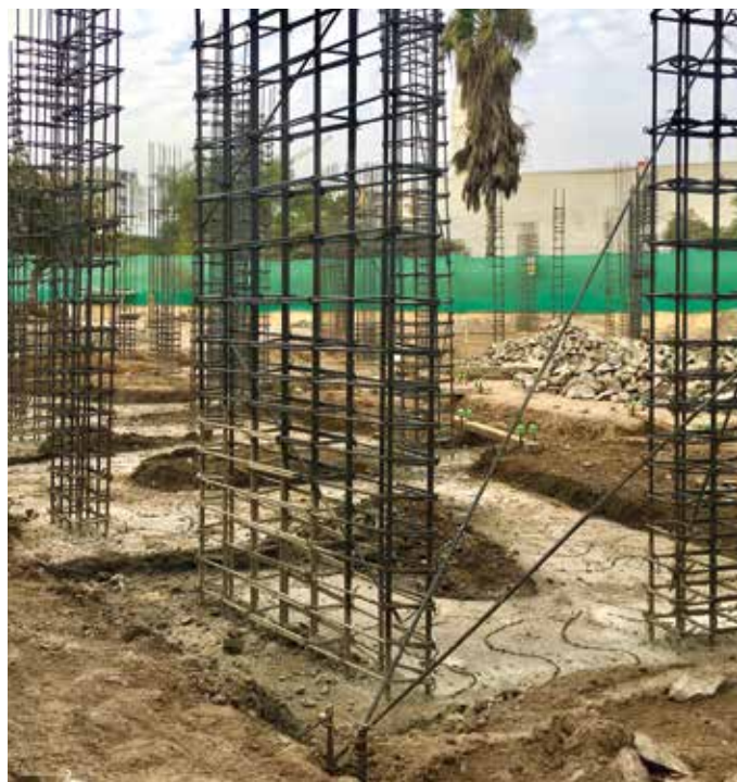
Fundering volledig gestort

Storten van de fundering, met het betonijzer voor de kolommen