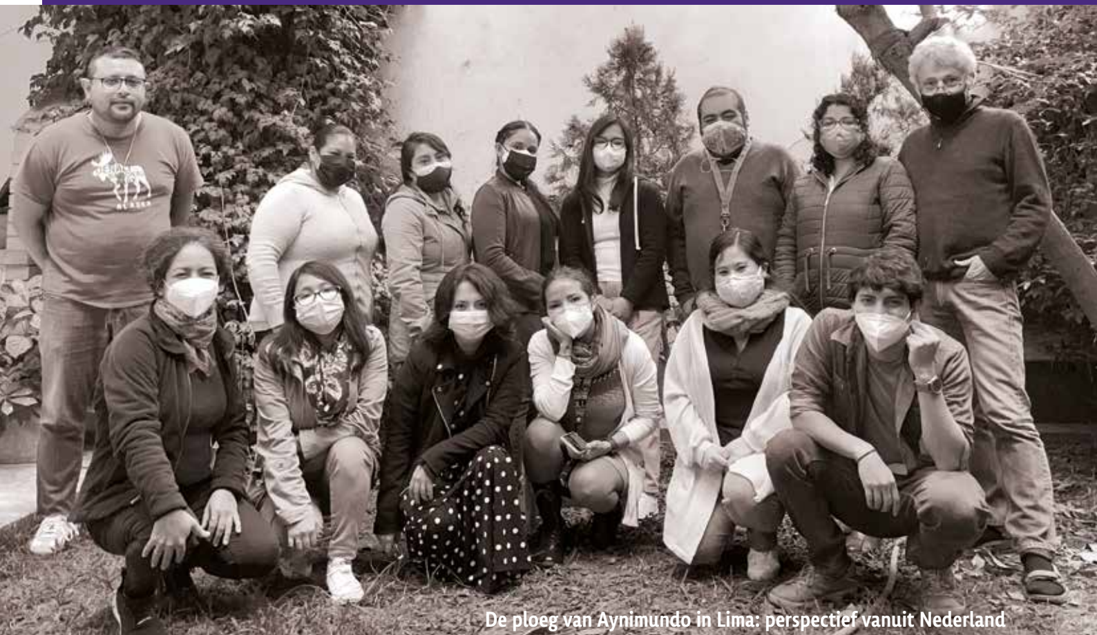
De ploeg van Aynimundo in Lima: perspectief vanuit Nederland