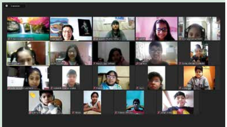
Les met zoom