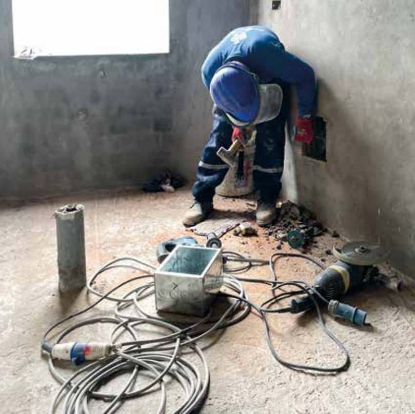
Buizen en leidingen