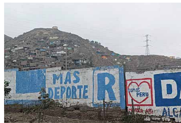
Veel onverslijtbare verkiezingsleuzen in Peru, op lange muren. In dit geval aan de voet van weer een heuvel vol nieuwe huisjes.

Weeffouten genoeg in Lima. Overall sporen van drugsgeld, corruptie. 'Kijk dat schooltje, dat kan hier helemaal niet. In een woonhuis middenin de wijk. Daar moeten de autoriteiten wat toegeschoven hebben gekregen.' Informatie gaat gepaard met grappen, bijvoorbeeld over alle vorige Peruaanse presidenten, die zonder uitzondering in de gevangenis zitten. Of over de corruptie, het witte poeder en jeugdbendes die hele wijken afpersen. Zure grappen, die maar eventjes opvrolijken. 'Doe dat maar niet', als ik mijn telefoon buiten het raam steek voor wat straatbeelden. En als er een motor achter ons rijdt. 'En doe je deur even op slot.'