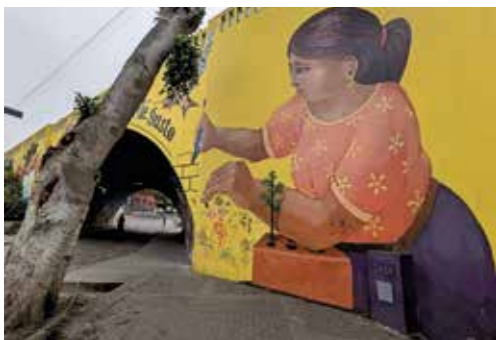
Murales, muurschilderingen, in Baranco, de hippe wijk van Lima, aan de voet van een van de heuvels waar zich dagelijks nieuwe migranten vestigen.

Ooit bedachten de Peruaanse autoriteiten dat precies hier de Panamerican Games van 2019 zouden plaatsvinden, legt Warmolt uit. Dat ging ten koste van trapveldjes, parkjes en een zwembad, allemaal zelf aangelegd door deze volkswijk zelf: Villa Maria del Triunfa. In plaats van balletje trappen en parkjes slenteren kijken ze sindsdien uit op onneembare hekken. Soms loopt er aan de andere kant een schaduw langs. 'Ja, veiligheidsmensen, die hebben er nu een baantje.'