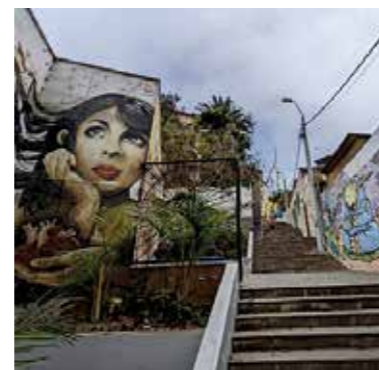
Nog meer murales in Baranco, ze vrolijken Latijns-Amerika vaak op.